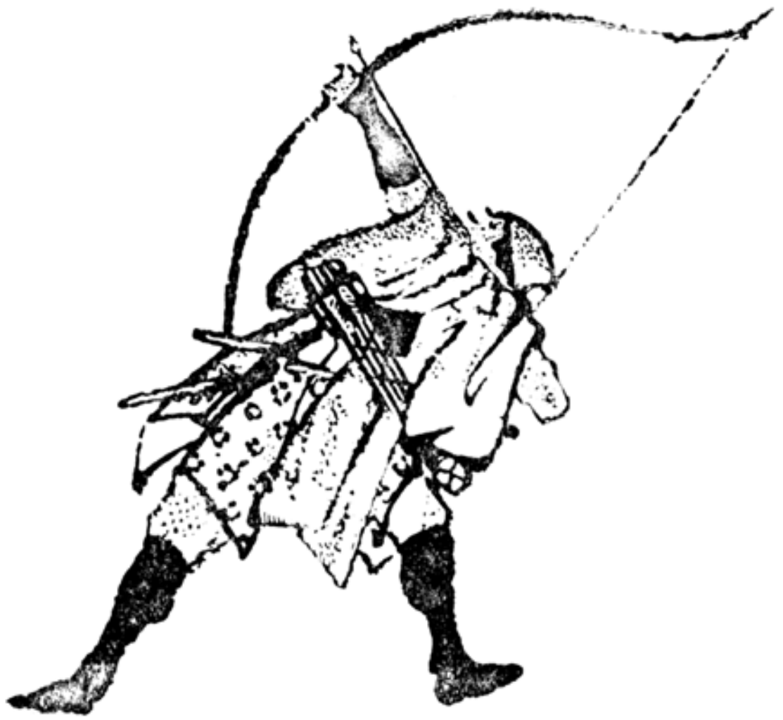
Arquero x Hokusai